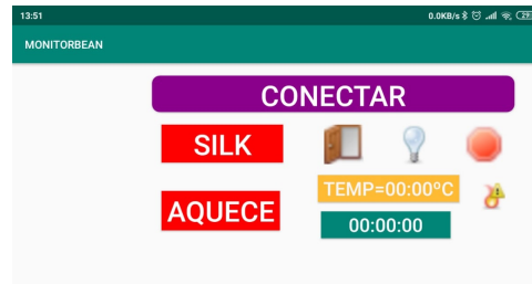
Fig. 2: Visão geral do aplicativo

Para começar a monitorar, basta clicar em ” CONECTAR ” e selecionar o dispositivo na caixa de diálogo que aparecerá.